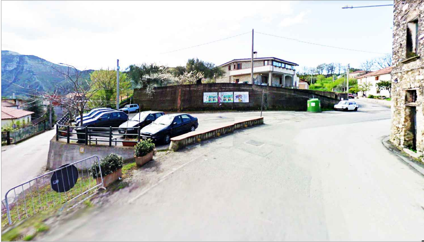
Punto di vista n.8 integrazione muretto al margine stradale