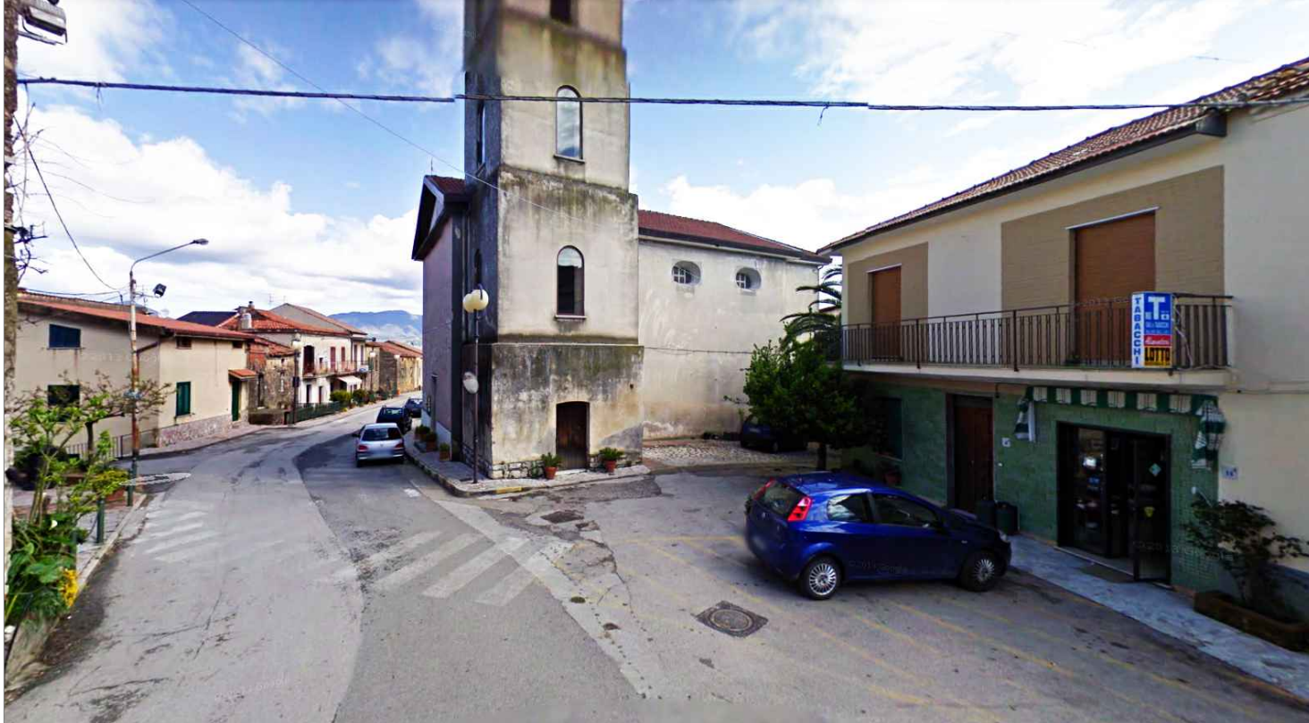
Punto di vista n.6 sostituzione di paramento ceramico - intonaci