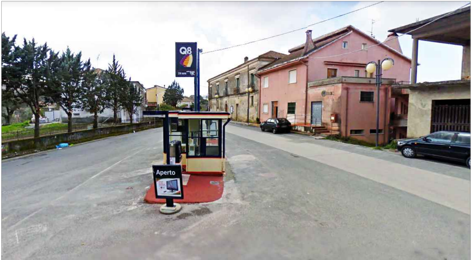
Punto di vista n.2 delocalizzazione impianto carburanti