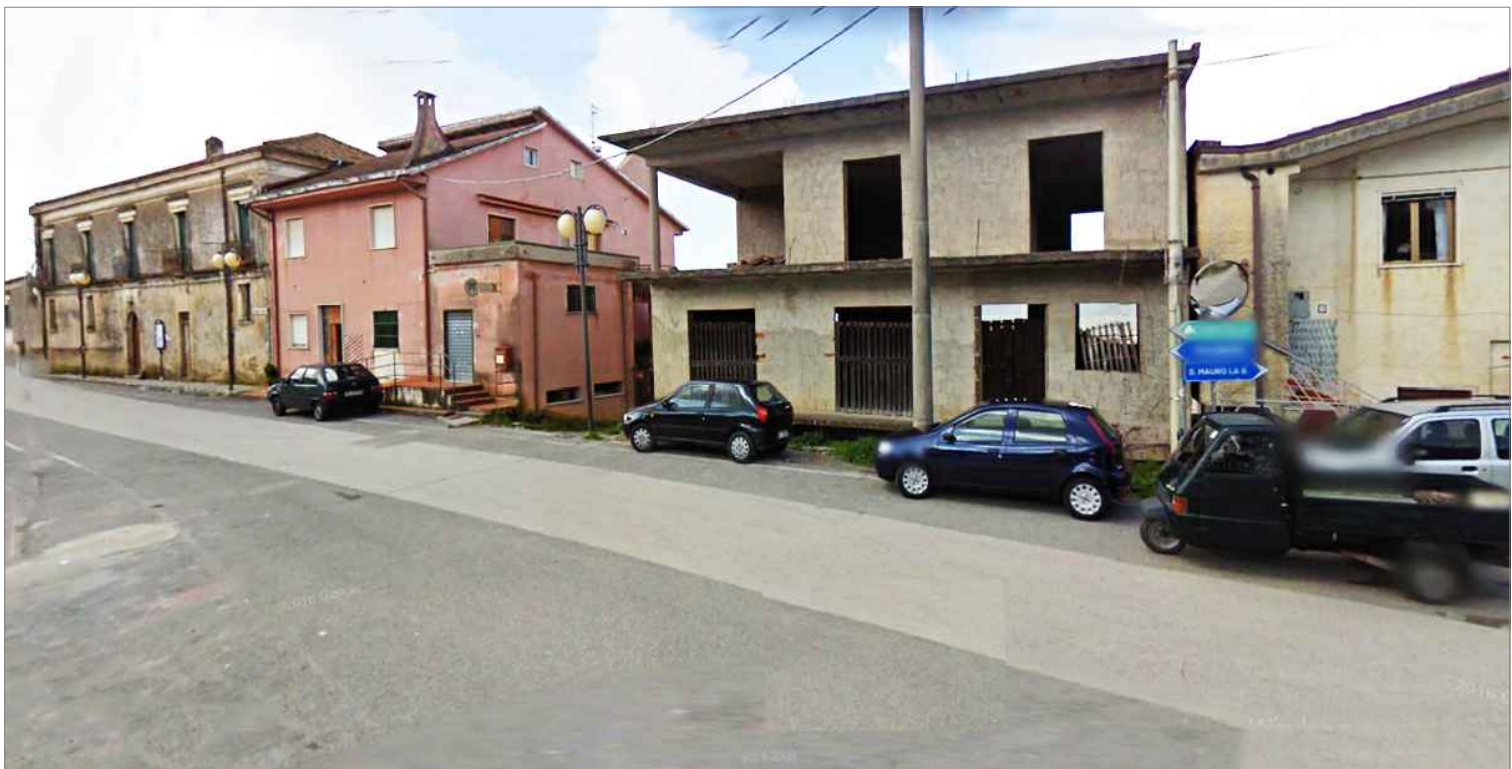
Punto di vista n.3 schermatura edifici non ultimati