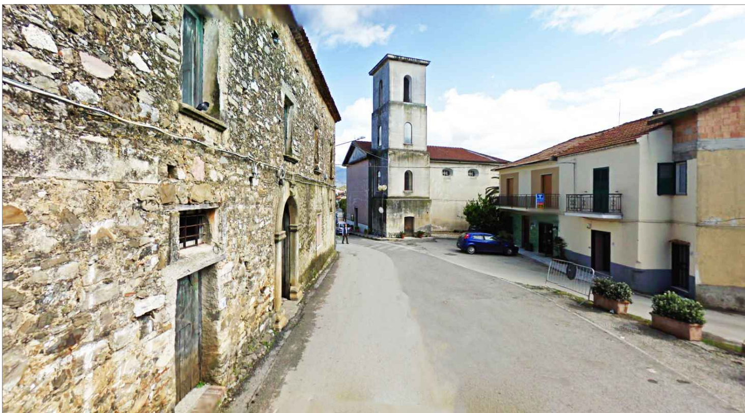
Punto di vista n.7 interventi di risanamento conservativo