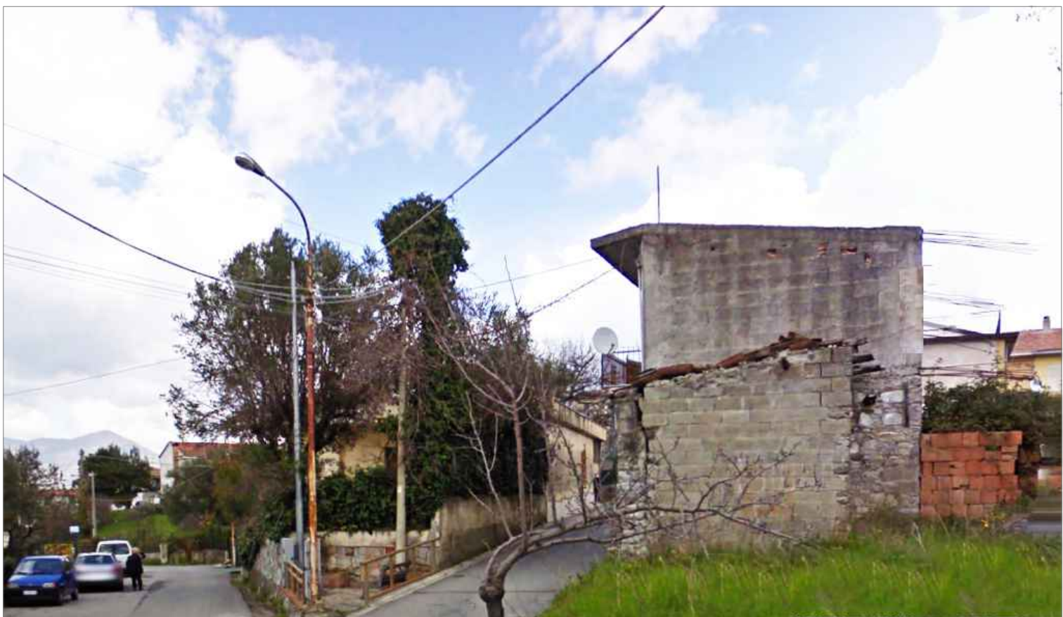
Punto di vista n.4 manutenzione edifici, sede stradali e margini