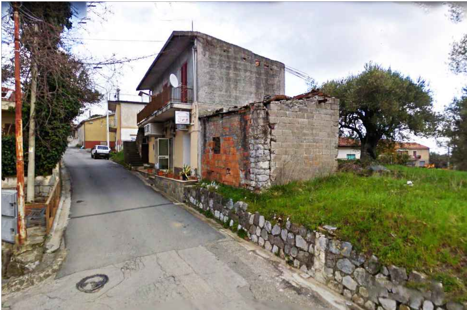
Punto di vista n.5 manutenzione edifici, sede stradali e margini