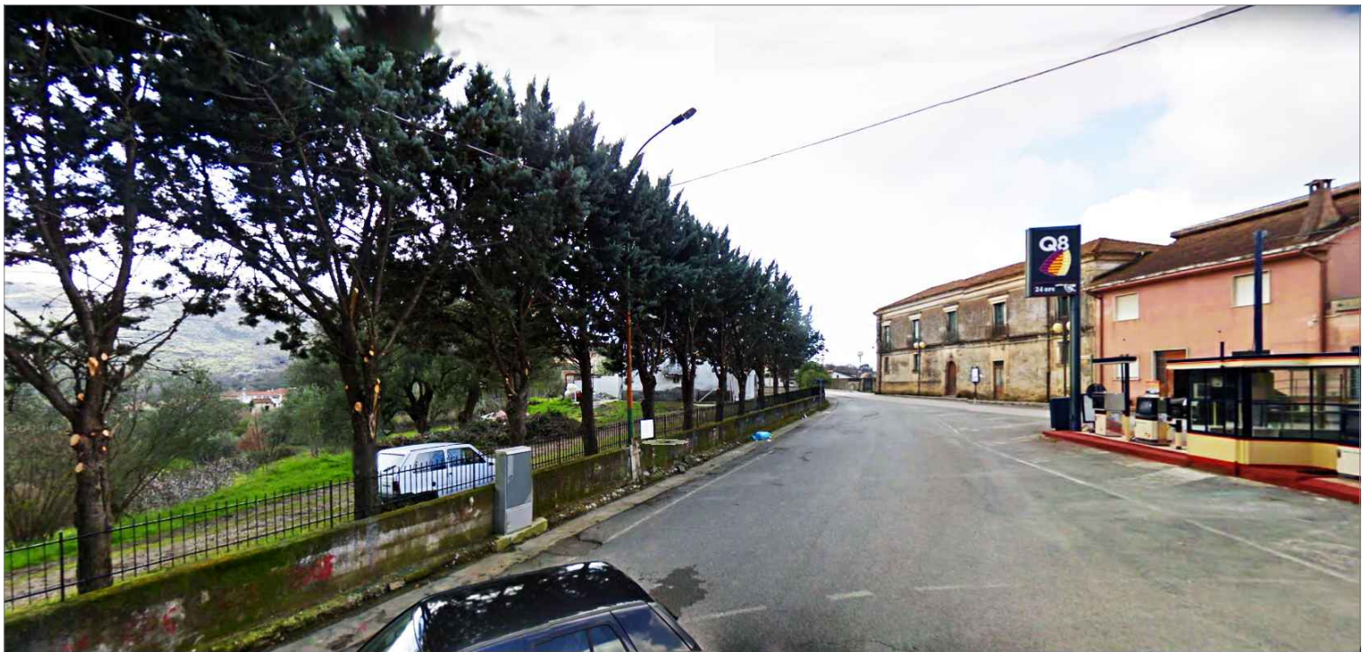
Punto di vista n.1 ripristino intonaci e recinzioni

Contesto 2 località: Foria - Piazza Madonna delle Grazie